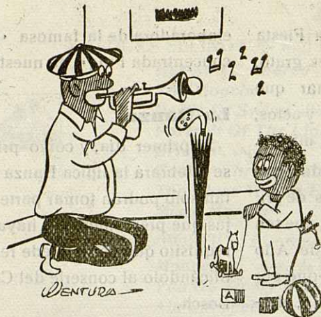
El paraguas <bop>