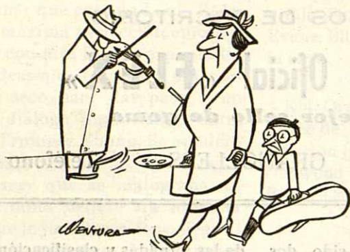
Los nuevos ricos

huevos. Al revés, región del Africa central.—4. Preposición inseparable. Sacrificio incruento, plural.—5. Al revés, envuelve. Nombre de varón.—6. Cincuenta y uno. Mamífero carnívoro. Voz militar.—7. Al revés, hueso de la cadera. Al revés, acto de amenazar.—8. Repetido niño pequeño. Vigilaré.—9. Parte saliente del tejado. Municipio de la isla de Cerdeña.—10. Temor, sospecha. Preposición.—11. Secta musulmana creada en Persia en el 1090. Existe.