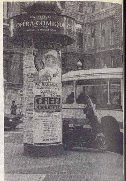
A França es continuen utilitzant els "pirulis" per informar al ciutadà

La regidora del nostre Ajuntament insisteix en el fet de que els municipis francesos no dubten ni un moment a l'hora d'informar al ciutadà. «És molt destacable els pressupostos generals dels Ajuntaments, que malgrat tenir pràcticament les mateixes competències que nosaltres, són tres-quatre vegades més grans que els nostres». I ens comenta un exemple prou clar: «Així doncs un poble com Blagnac -prop de Toulouse- amb 15.000 habitants té el pressupost més