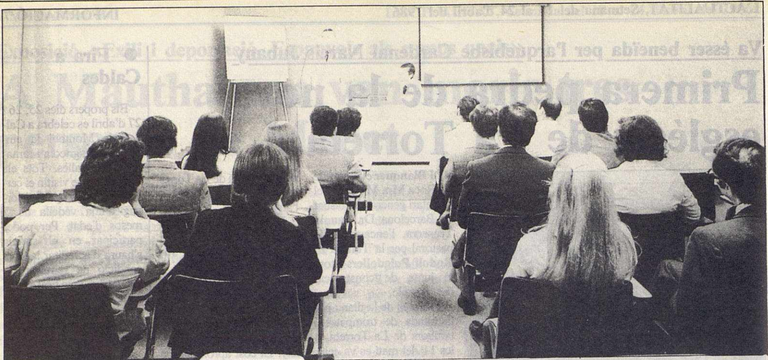
Aula per formació de persones de nova contractació a Lucta.