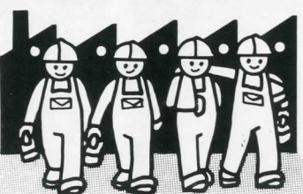
Para los trabajadores de su empresa

Sección MEDICO-QUIRURGICA: Servicios de asistencia sanitaria médico-quirúrgica a partir de 690,- Pts. mes. Sección Decesos: Auxilios económicos y servicios en caso de fallecimiento, a partir de 30,- Pts. mensuales.