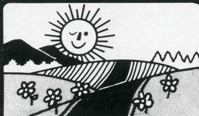
La tranquilidad y seguridad de un futuro sin riesgos

Servicios que ofrece: - Higiene de la Industria y de los trabajadores. - Prevención de accidentes de trabajo y enfermedades profesionales. - Formación higiénico-preventiva de los trabajadores. - Asesoramiento y comités de Empresa - etc.