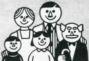
Para Vd. que es previsor y su familia