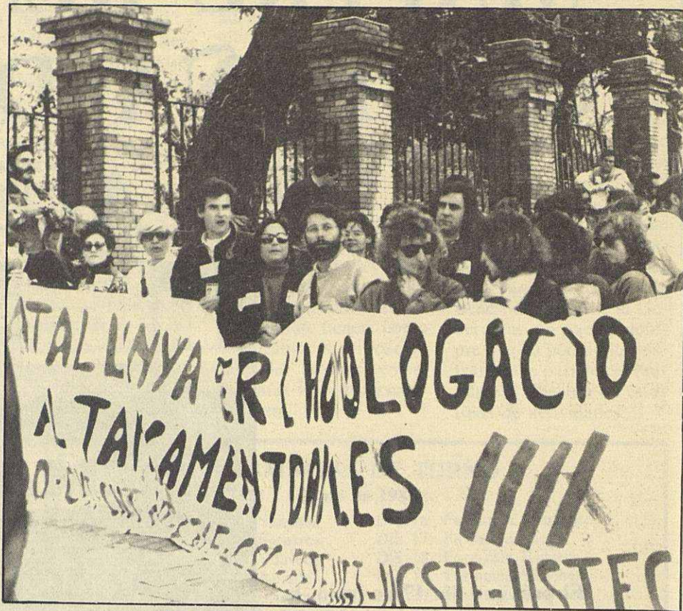
Los maestros llevan siete meses manifestándose

—Busqui un sistema per tal d'impedir que un director hagi d'anar a judici a donar explicacions de les lesions que un alumne del seu centre s'ha