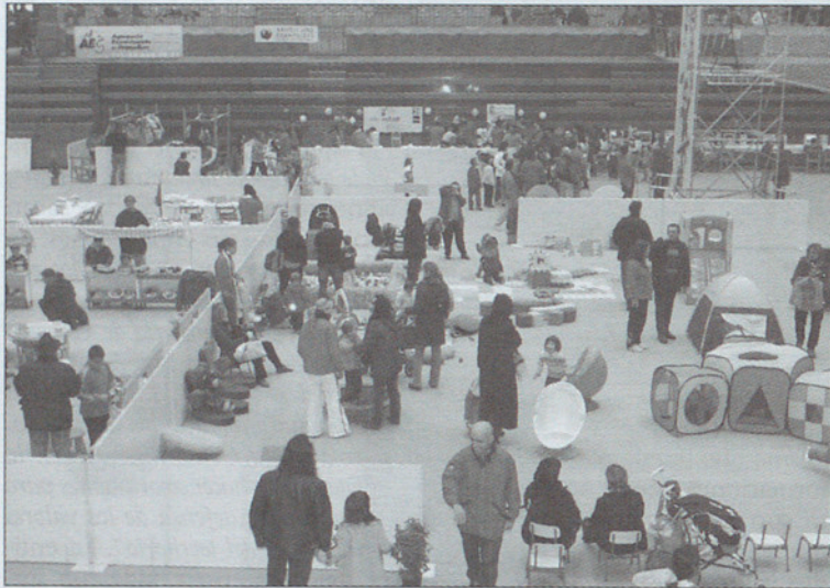
Aspecto de la pista central el pasado martes a media mañana.