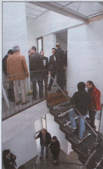
Un momento de la visita a las obras de Can Jonch, el pasado lunes por la mañana.

del edificio se instalará un centro de documentación y formación especializado en la