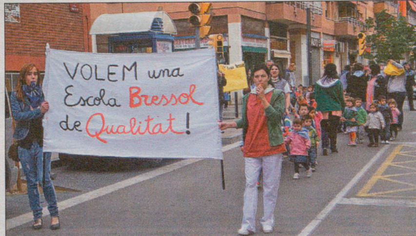
Las guarderías de Canovelles se concentraron en la plaza de la Joventut.

Como es habitual no hubo acuerdo sobre el seguimiento de la huelga convocada en el sector de la educación este martes contra los recortes educativos y que, por primera vez, afectaba a toda la comunidad educativa y a todos los ciclos escolares desde las guarderías hasta la Universidad. El mismo martes por la tarde el Departament d'Ensenyament cifraba en un 32,7 por ciento el seguimiento de la huelga en los centros públicos del Vallès Oriental y el Maresme. CC.OO., desde la Unió Intercomarcal del Vallès Oriental-Maresme daba cifras dispares por niveles: el sindicato hablaba de un seguimiento del 55% en primaria, paralización completa en secundaria y universidades y cumplimiento de los servicios mínimos en las guarderías. Las cifras oficiales sitúan el Vallès Oriental y el Maresme