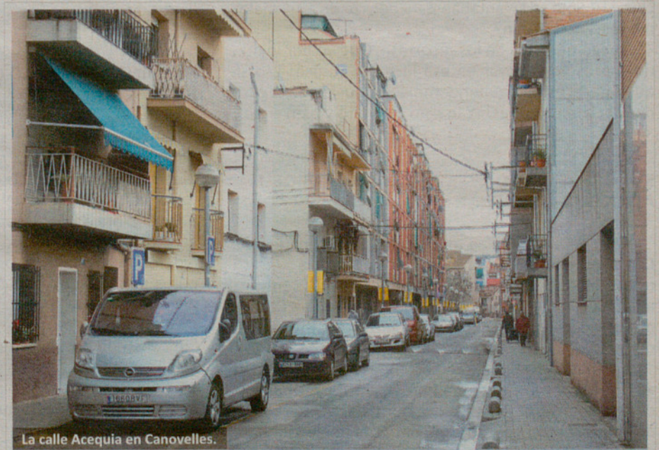
La calle Acequia en Canovelles.