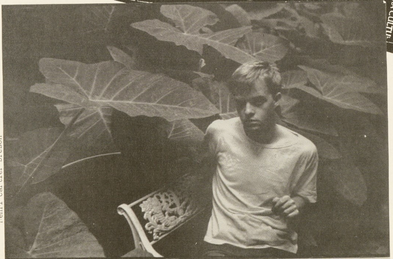
Henri Cartier Bresson