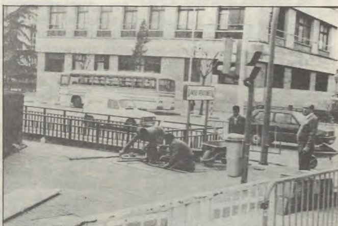
Només les voreres reclamen sis o vuit homes permanentment.