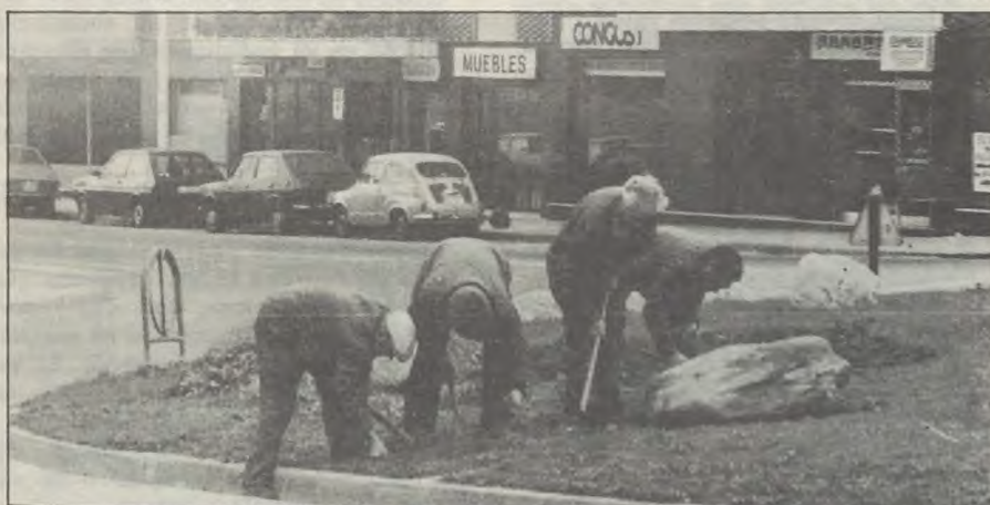
Vetllar pels parcs i la gespa dels espais verds.