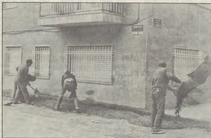
Hi ha sis formigoneres, i feina per setze....

Las tareas a desempeñar están supervisadas por los servicios técnicos del Ayuntamiento; allí se reciben las peticiones de reparaciones y a continuación se pasan a la brigada para que se haga cargo de realizar las obras. Estos partes, que cualquier ciudadano puede cumplimentar en la cuarta planta del Ayuntamiento, son el conducto reglamentario para que las peticiones (aviso de rotura de alcantarillado, desperfecto de aceras), puedan ser atendidas en un tiempo breve. Desde la implantación de estos partes, en el pasado enero, se han registrado 313 peticiones.