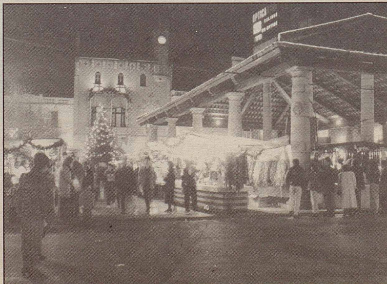
Paradetes a la plaça de la Porxada durant el Nadal