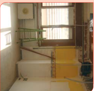
Espai lúdic i formatiu per a la futura CiberCaixa

Les tecnologies de la comunicació tenen un paper rellevant en les CiberCaixes Hospitalàries. Estan dotades amb ordinadors amb connexió a Internet, escaner, càmera digital, cd's, programes educatius interactius, i jocs. A més, els nens i nenes disposaran d'una adreça de correu electrònic pròpia que els permetrà relacionar-se amb els seus amics de l'escola, els seus professors o altres infants que, com ells, estan ingressats en algun altre hospital.