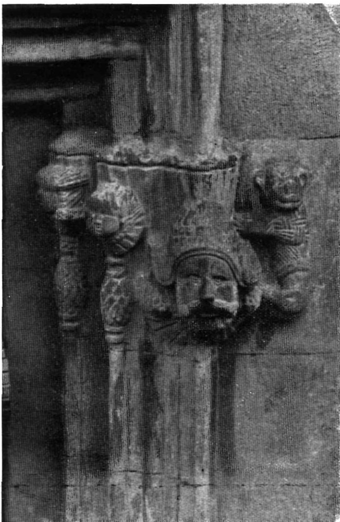
Detall de la finestra, avui balcó, de transició a l'estil Renaixement. Segle XVI : Carrer del Doctor Riera