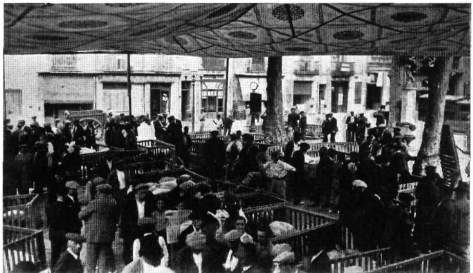
El mercat de porcs a l'estiu, sota un envelat de festa major.