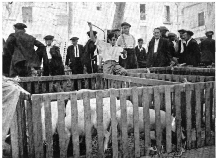
Una gàbia de porcs.