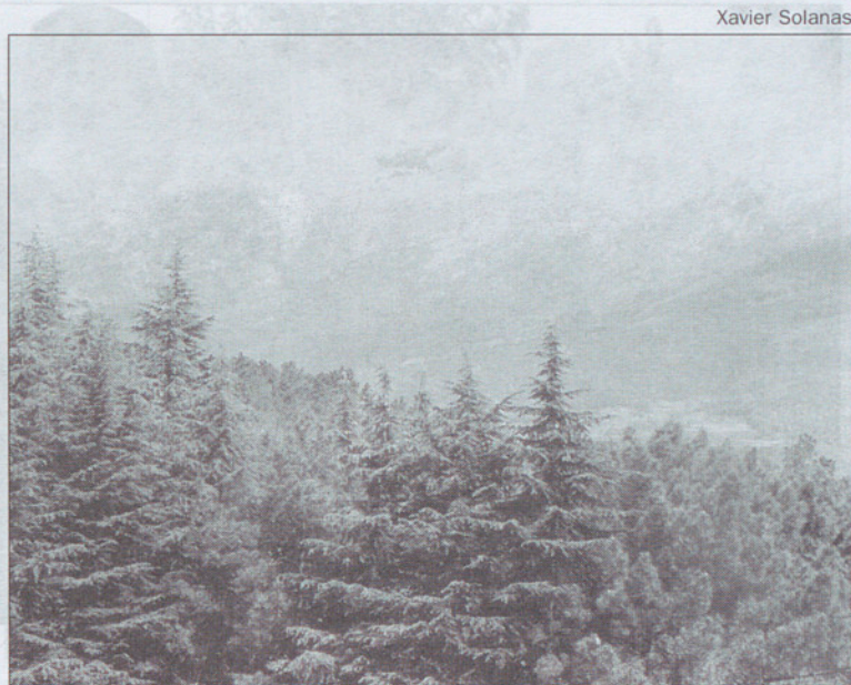
Vista del Turó de l'Home.

La revisión podría comportar, según han apuntado fuentes de la Diputación de Barcelona, por primera vez en estos 25 años, una ampliación del ámbito del Parque Natural. La medida tendría como objetivo facilitar la conexión de este espacio protegido con los parques naturales del Montnegre-Corredor y Sant Llorenç del Munt. En el primer caso, para unir los dos parques, se encuentran los bosques de Gualba, mientras que, en la segunda zona, está el extenso territorio de los Cingles de Bertí, en gran parte incluido en el PEIN como espacio de interés natural y Gallifa. La conectividad de estos espacios vecinos forma parte del proyecto territorial de Anella Verde Metropolitana promovida por