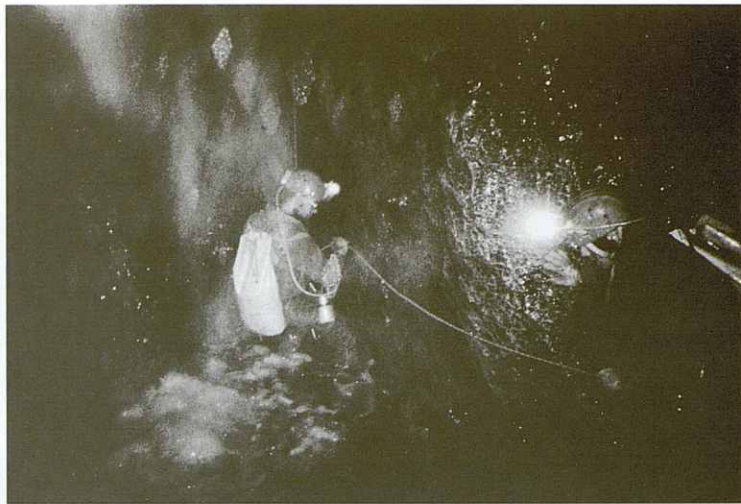
Cascade des Topographes -720 m.

de l'avenc, el soroll ens embogeix. Tot i que la instal·lació de la corda està separada de la cascada, és inevitable la mullena que juntament amb el fort corrent d'aire originat per la caiguda de l'aigua des de tanta alçada, fan que s'hagi de procurar baixar sense entretenir-se massa. En arribar a la base haurem de refugiar-nos de l'aigua i del vent que ens apaga els carbures i emprendre ràpidament camí cap al fons.