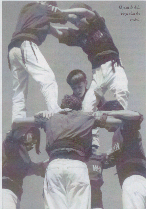
El pom de dalt. Peça clau del castell.

Durant una agraïda pausa (ho diem pels croissanets, ensaïmadetes, cafès i d'altres) i després de contraposar idees