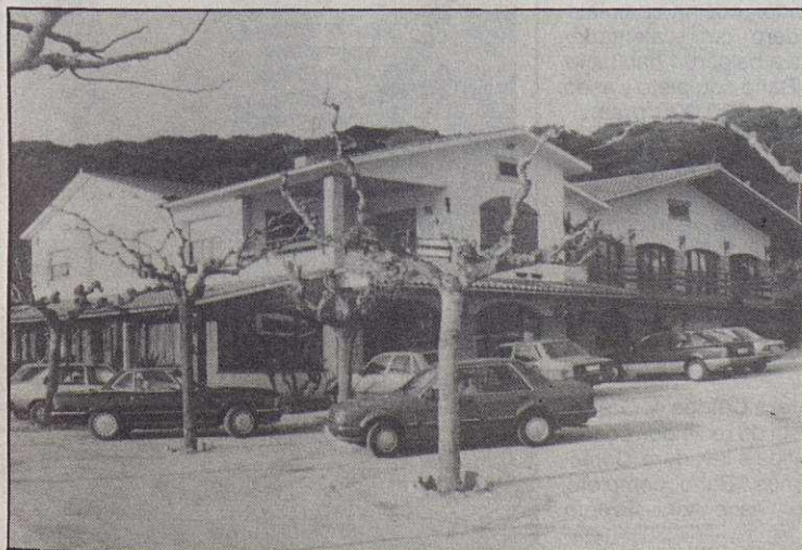
El restaurant Mont-Bell