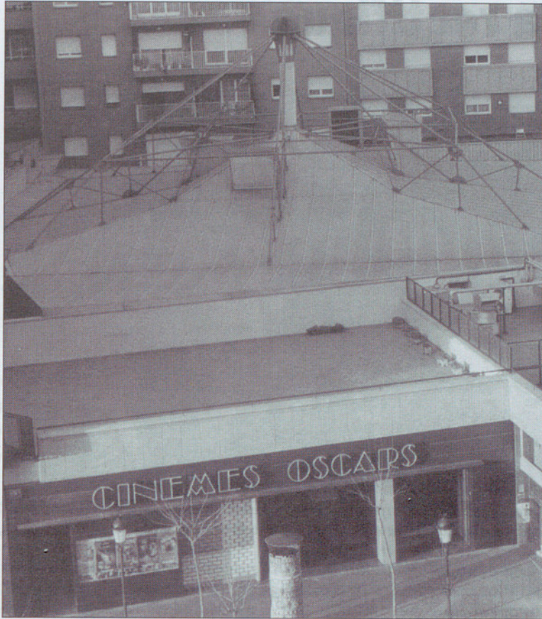
Los cinco millones de pesetas que separan la oferta de la demanda no parece que vayan a ser una barrera infranqueable.

En primer lugar, porque una vez que el Tribunal Supremo ratificó la Sentencia del Tribunal de Barcelona y adquirió firmeza, como el Ayuntamiento de Granollers no ejecutó voluntariamente dicha Sentencia, me vi en la obligación de solicitar la Ejecución Forzosa, circunstancia que en estos momen-