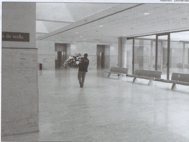
Interior del centro, que cuenta entre otras instalaciones con 10 velatorios.

Y es que, como puede verse, los servicios funerarios tienen un alto componente de servicio social. Y