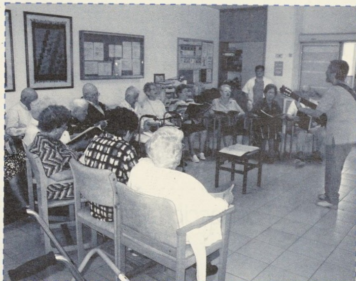
La Coral de l'Alegria va tancar la celebració del Dia Internacional de la Gent Gran