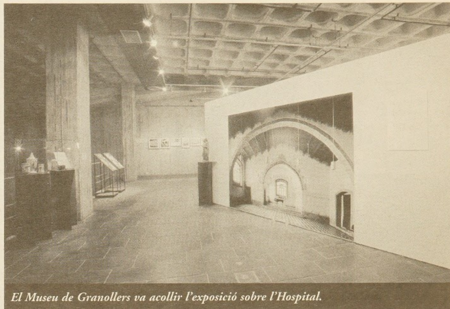
El Museu de Granollers va acollir l'exposició sobre l'Hospital.