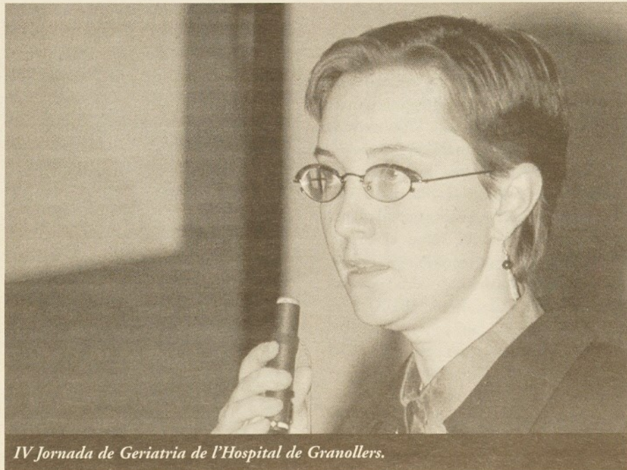
IV Jornada de Geriatria de l'Hospital de Granollers.

Aquests espais repassaven la història de la institució i anaven acompanyats d'un darrer àmbit, dedicat a l'Hospital actual, que mostrava una part del treball que diversos fotògrafs de la comarca han fet sobre l'Hospital durant els darrers mesos. Les fotografies de Pere Cornellas, Ramon Ferrandis, Josep García, Dolors