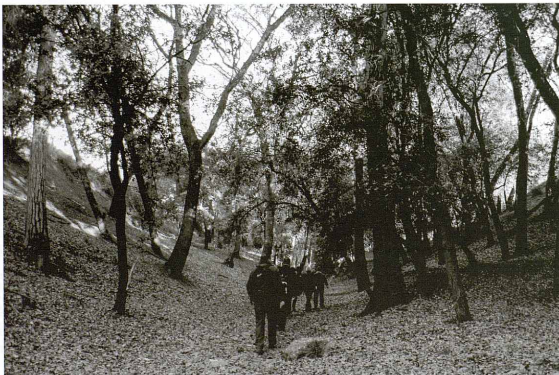
Torrent del Fangar.

mostra evident de la disminució de pluges i del canvi climàtic. Travessem la carretera BV-1419 en direcció al bosc de can Pagès Nou, la pineda i el bosc de can Màrgens i el Pla de Llerona al nostre pas per can Pere Lleó, can Girbau, can Pagès Nou i can Màrgens; davant de can Pagès Nou fem una petita aturada d'uns 30 minuts per esmorzar l'entrepà que hem portat de casa i gaudir de les vistes del Pla de Llerona,