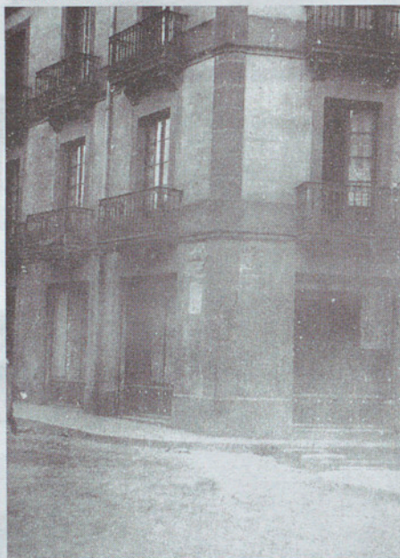
Confecions Montaña (1867).