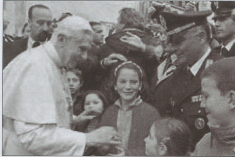
Benedicto XVI, en su primera audiencia pública el pasado miércoles.

"Yo creo que debería ser abierto y capaz de seguir acercando la Iglesia a la gente, como ya hizo su predecesor", indicaba uno de los encuestados. En el mismo sentido, otro encuestado espera que el nuevo Papa "siga la línea de Juan Pablo II", es decir, "que abra la Iglesia a la gente y que la adapte al estado actual del mundo,