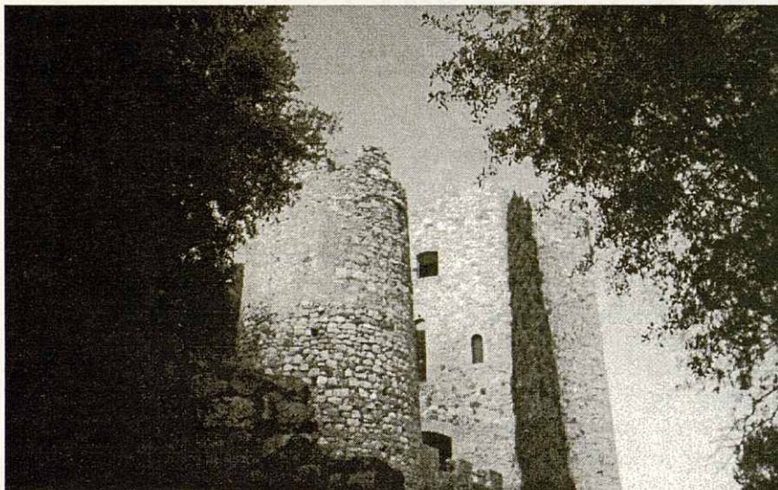
Castell de La Roca.