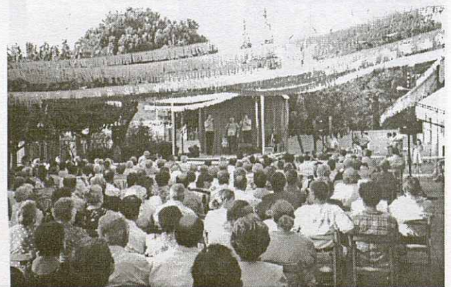
A la tarda, a beure rom cremat escoltant havaneres.