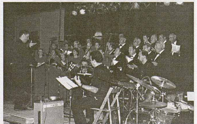
L'ànima s'enlairava amb les melodies dels espirituals.