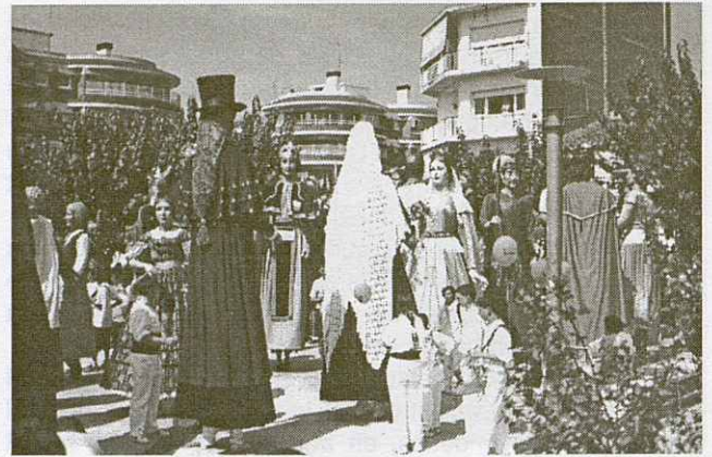
Gegants de moltes contrades ballaren pels nostres carrers.