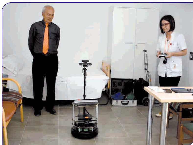
El projecte RADIO va dur a terme la seva fase de pilotatge al Centre Geriàtric Adolfo Montañá Riera