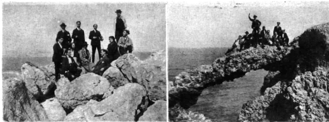
Els aficionats de La Unió Liberal.—Record d'una excursió a Torroella de Montgrí, on representaren «La Reina de la Festa», d'Esteve Garrell. Dnes fotografies fetes a Empúries

El nom del nostre Cor va lligat a totes les festes de caritat que s'han celebrat a Granollers. Obrers tots els cantaires, mai no han desdit quan s'ha