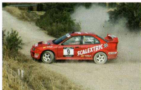
Enric Folch-Joan Argemí

Subcampions del grup N-4, de Ral·lis de terra