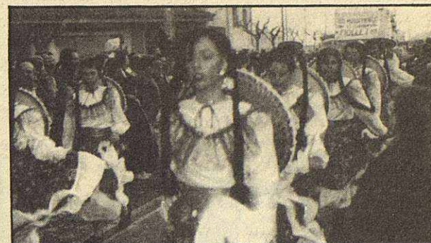
Todos se apuntaron a la fiesta