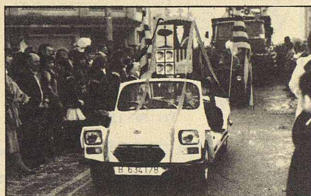
El Centro Aragonés no se perdió una vez más la cita