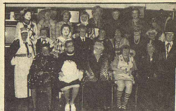
El «Esplai» de Gent Gran también celebró su carnaval