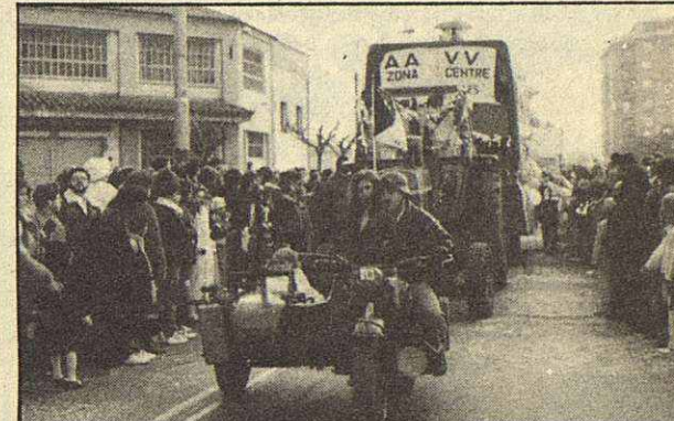
La AA.VV. de la zona centro se apuntó a la fiesta.