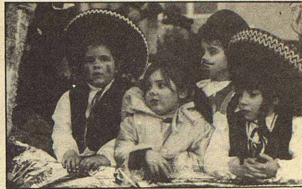
Los niños se dejaron notar con sus atuendos.