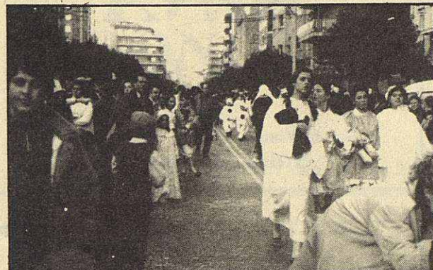
La participación de público fue masiva