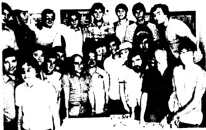
Recepción en la sede del Club de Coimbra.

vo lugar la final o de problemas ión de Coimbra, tado final de 8- to de esta mane-