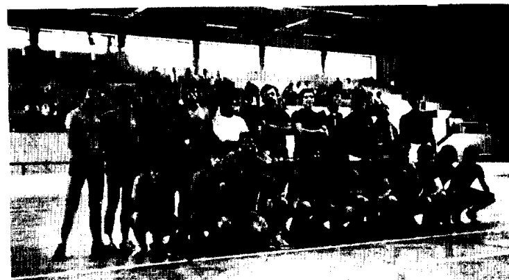
El equipo del Almada y de los Escolapis, en la final del Torneo de Sesimbra.