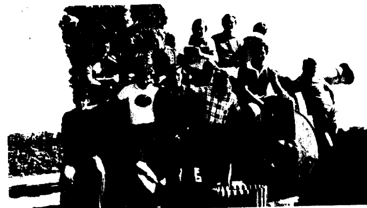
Apuntando ya en dirección a Granollers, desde el Castillo de San Jorge de Lisboa.