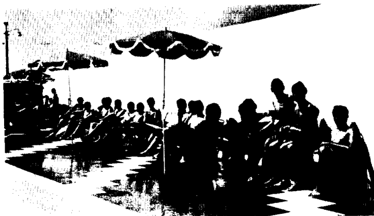
Como se puede apreciar fácilmente, la estancia fue de lo más cómodo.