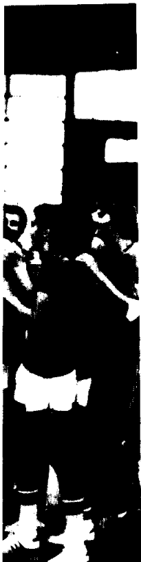
ar en las foto-

le campeones del llas al mejor porador más correc- Unzueta, respec- e destacar que al