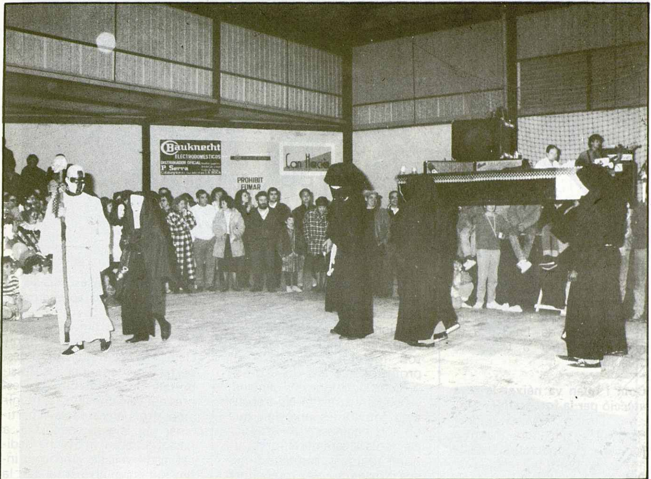
La comparsa MISERERE MEI, guanyadora del segon premi per a comparses.