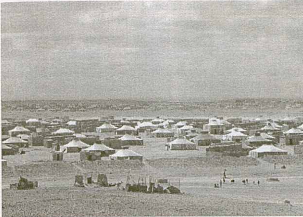
Campament d'El Aaiún Hamada, Algèria.

referèndum s'ha anat retardant, el territori s'ha anat marroquinitzant; procés afavorit pel llarg mur de defensa construït per preservar les explotacions de fosfats i els principals nuclis urbans dels tacas del Front Polisari.