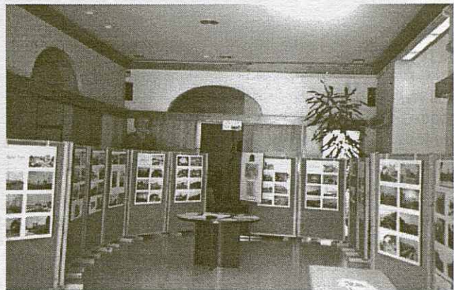
Durant els quatre dies de festa es va poder visitar al vestíbul de l'Ajuntament una exposició fotogràfica sobre els 150 anys del primer ferrocarril (Barcelona-Mataró)