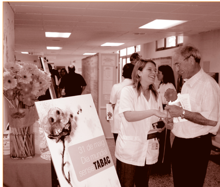
Els professionals regalaven una flor a les persones no fumadores o en procés de deixar l'hàbit