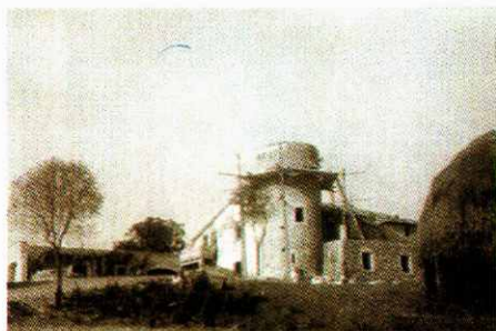
La construcció de la torre el 1954.