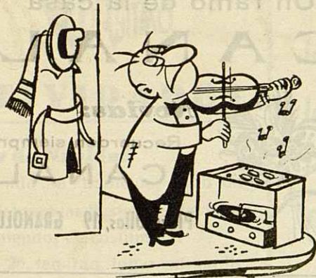
EL POBRE LISTO