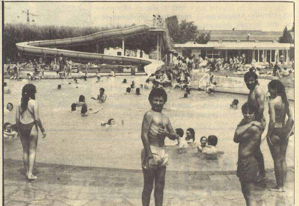
Las terrazas del centro suelen estar así de concurridas

Motocultors Motoaixades Motobombes Tallagespa Polvorització Motoserres Reparació