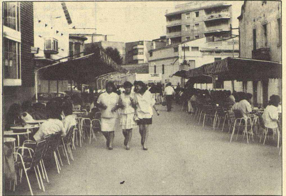
La piscina es lo más recomendable para los que se quedan en Mollet