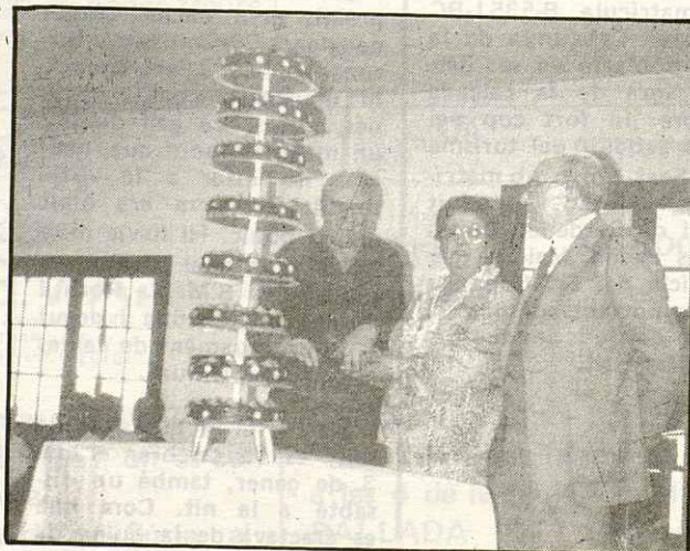
Dos moments del dinar: En l'un, tothom s'atipa de valent, en l'altre, podem veure com és tallat el magnífic pastís.