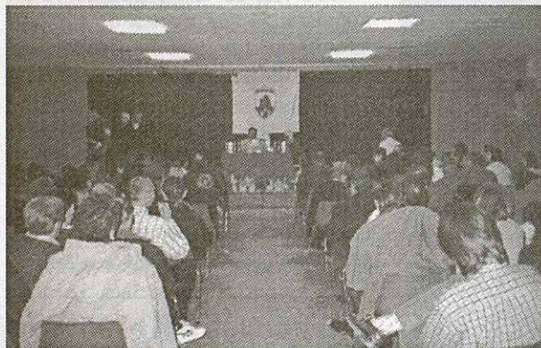
La Quina de Reis ja és tradicional en aquestes dates

Un altre dels actes que s'han organitzat aquestes festes, han estat les tradicionals quines de Nadal i de Reis que es van celebrar els dies 28 de desembre i 4 de gener respectivament. A diferència d'altres anys, enguany s'han celebrat a l'IES La Roca, cosa que sortosament no va afectar al nivell d'assistència. Els tradicionals pollastres, porcs ( aquest any 2 ), bicicletes i tot tipus de regals es van sortejar com cada any tot i que a la quina de Reis es va introduir una petita modificació. Amb la compra d'un cartró podies guanyar tres premis: la quina, el ple i un segon ple. El segon ple s'adjudicava continuant extraient números fins que hi havia una segona persona que omplia el cartró.