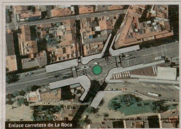
Enlace carretera de La Roca

El Grupo Municipal de CIU, asesorado por la empresa Intra que elaboró el Plan de Movilidad de la ciudad en 2008, plantea ahora al Ayuntamiento la construcción de dos rotondas: una en el cruce de Girona con la carretera de Cardedeu (que en su día fue desestimada), en que la rotonda ocupa una parte de los pequeños jardines de la acera; y otra en el cruce con la carretera de La Roca, tal y como puede verse en las imágenes.