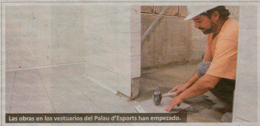
Las obras en los vestuarios del Palau d'Esports han empezado.

Granollers es la sede que tres meses antes del inicio del Campeonato del Mundo más entradas ha vendido: 2.383, quinientas más que Madrid, gracias a las aficiones francesa y alemana que están comprando el grueso de las entradas. El Campeonato se disputará a mediados de enero. Las obras de reforma del Palau d'Esports ya han comenzado. Serán las más importantes desde que la instalación fuera inaugurada para celebrar los Juegos Olímpicos de Barcelona 92