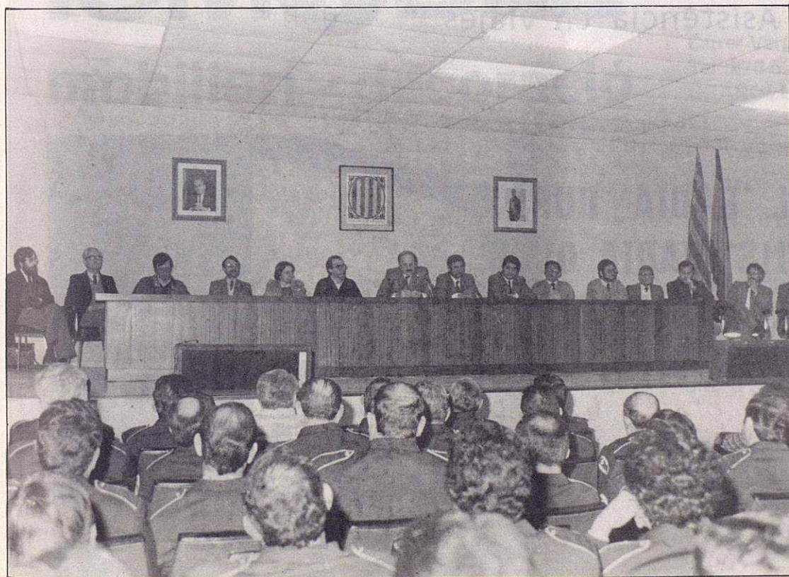
Una vista general de la sala y de la presidencia del acto, con motivo de la inauguración de las nuevas dependencias de la Guardia Urbana de Granollers