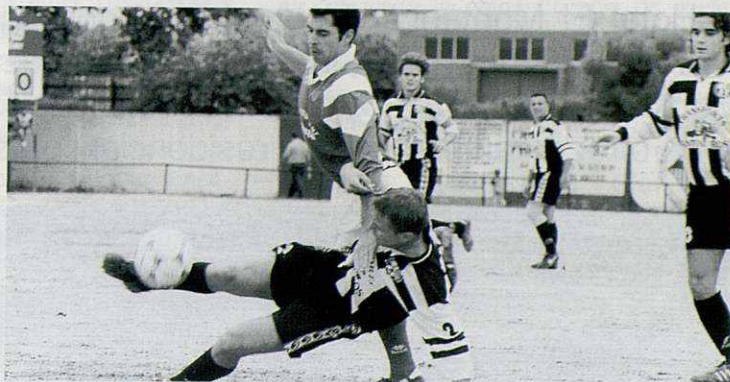
Al Sta. Perpètua no le salen las cosas esta temporada