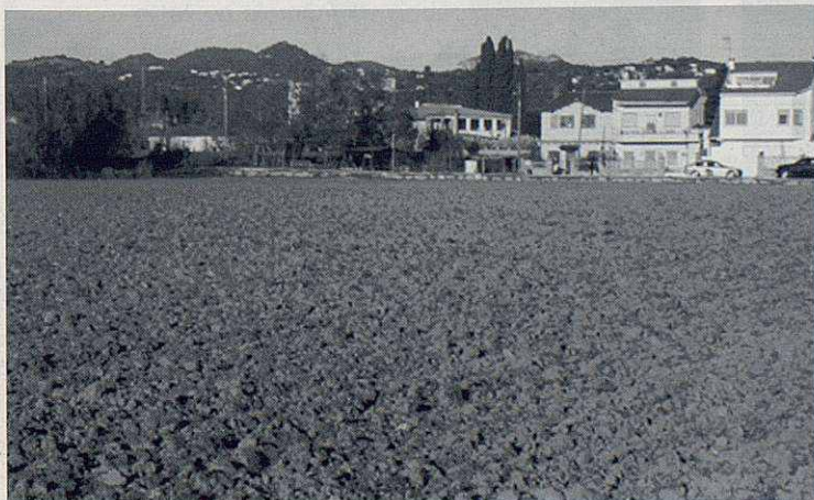
Les terres bones de la terrassa baixa del Tenes al seu pas per Sant Isidre, a la part baixa de Santa Eulàlia.

- A les terrasses, durant segles s'hi han anat perfilant àrees agrícoles fèrtils, de regadiu en els llocs on, segles