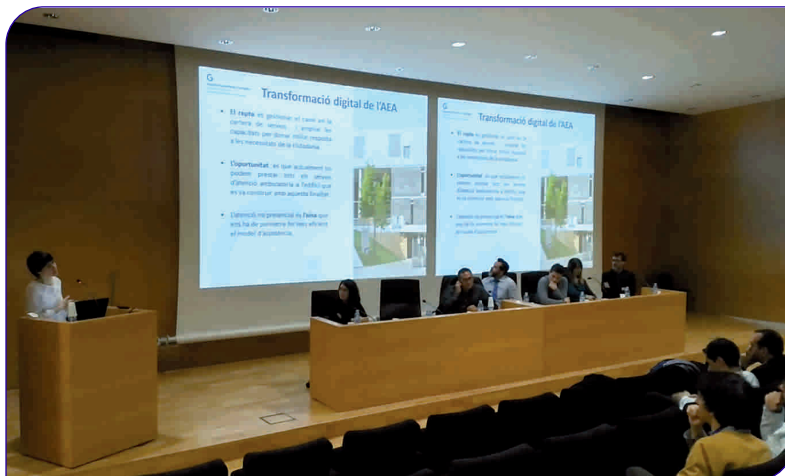
El projecte GHATA es va presentar en la jornada "Reptes i oportunitats en el sector salut: col·laboració públicoprivada"

Des de l'inici de la campanya, l'octubre de 2017, el Punt d'Informació de Consultes Externes és qui gestiona part de les incidències i en coordina les altes, que tenen una dinàmica de 235 noves altes per setmana.