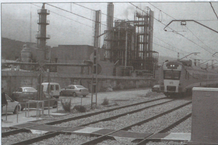
Los pasos a nivel desprotegidos constituyen un peligro para los vecinos de Sant Celoni.

En relación al calendario de actuaciones de dicho acuerdo, según lo determinado, los pasos a nivel serán suprimidos dentro de su período de vigencia que en principio se establece en seis años. En concreto en relación al